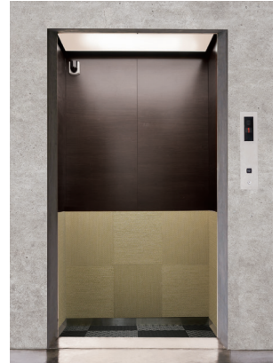
【使用素材】G-003(床:ReFace Tile J-005)